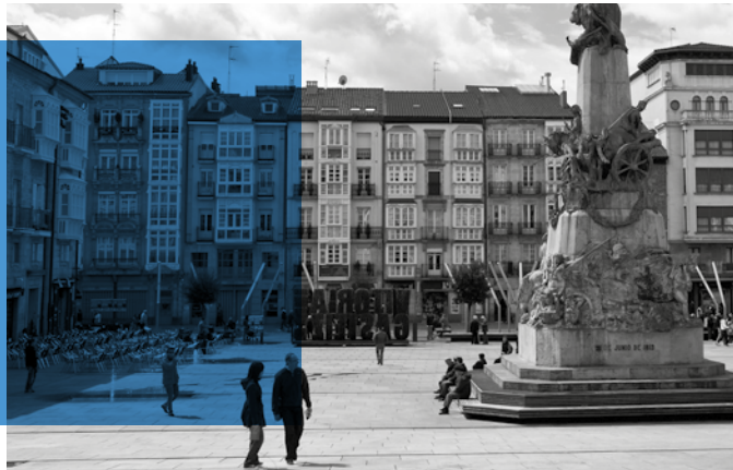
PLAZA DE UN PUEBLO “Generando espacios de encuentro y convivencia donde estar, ser, entrar, salir... sin barreras.”